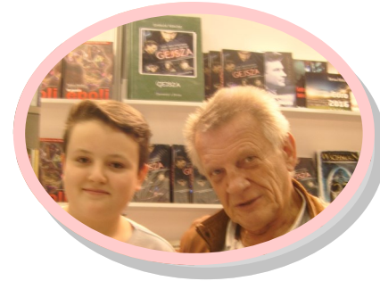
i Bronisław Cieślak