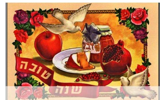
Symbolika żydowskiego stołu noworocznego