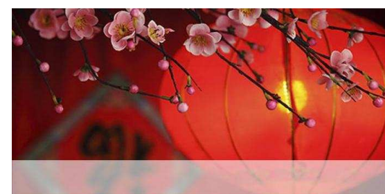
Symbol Chińskiego Nowego Roku