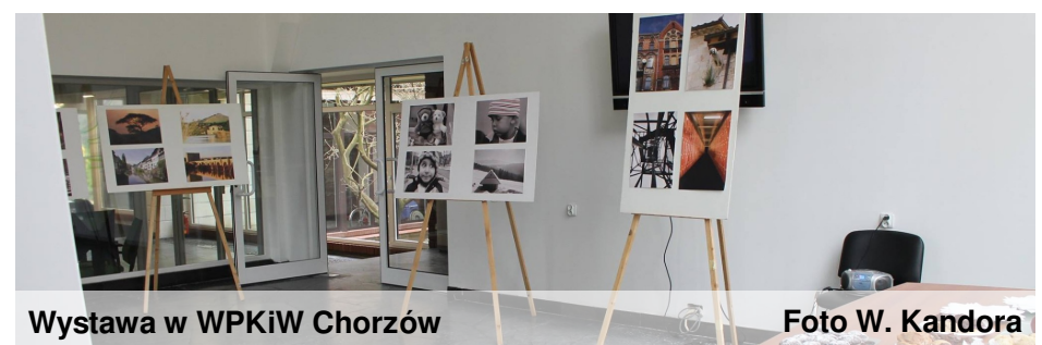
Wystawa w WPKiW Chorzów

Z okazji jubileuszu 55-lecia naszej biblioteki szkolnej każda z klas proszona jest o podarowanie książek naszej bibliotece (lista książek na tablicy ogłoszeń) jako prezentu urodzinowego. Również każdy uczeń może podarować książkę którą on sam zaproponuje. Książki należy dostarczyć do dnia 8 maja 2015 r. do biblioteki szkolnej.