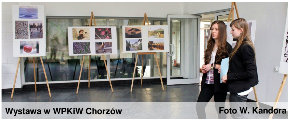
Wystawa w WPKiW Chorzów