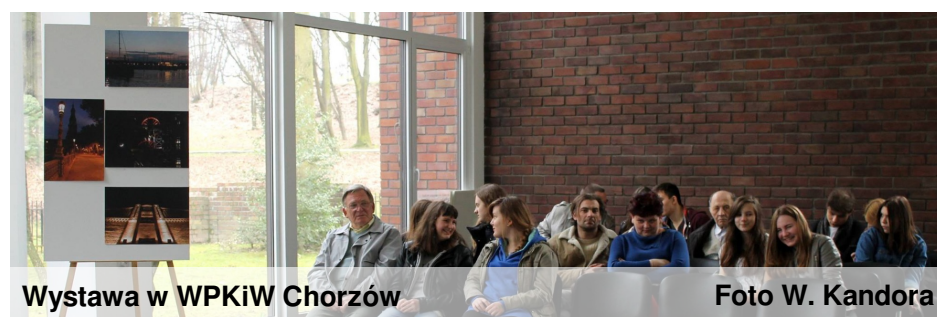
Wystawa w WPKiW Chorzów